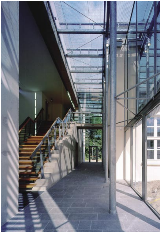
Museum Dinslaken: gläserne Passage