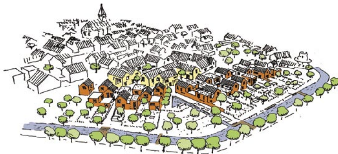
Patchwork, Dorf Bevergern: Schaubild

Der in seiner räumlichen Ausprägung erhaltene Ortskern aus dem 14. Jahrhundert war in historischen Erweiterungsschritten in kreisbogenförmigen Schichten gleichsam schalenförmig umlagert worden. Dieses Prinzip der Erweiterung wird aufgenommen und weiterentwickelt. Der Ortskern wird ergänzt, um ihn wird eine zweite Schicht in Form eines Neubaubandes gelegt. Dieses Bebauungsband ist an vier Punkten durchlässig. Für die Ortskundigen führen Wege über halböffentliche Höfe zu Sitzplätzen am Wasser und über den alten Wallgraben. Sie verweben das neue Quartier mit dem umgebenden Dorf.