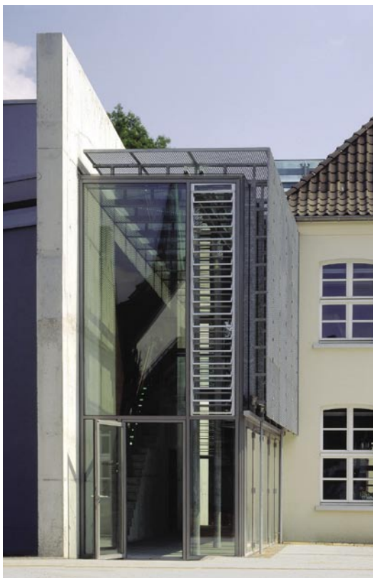
Museum Dinslaken: Anbau