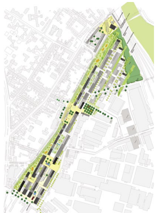
On the track: Lageplan

Die Bebauung wird ebenfalls aus dem Konzept der programmatischen Bänder entwickelt. In der linearen Baustruktur sind Ungleichzeitigkeiten in der Art und Dichte der Nutzung angelegt. Pioniernutzungen werden in einer zweiten Besiedlungsschicht weiterentwickelt, die Hallen werden erneuert, umgenutzt oder nachverdichtet. So entsteht ein durch permanenten Wandel geprägter postindustrieller Wohn- und Gewerbestandort. Seine vielfältigen und variablen Nutzungsmöglichkeiten machen ihn zukunftsfähig. Dabei sind die Grünräume die imagebildende Konstante in dem sich selbst entwickelnden System. Sie machen die Qualität dieses Standortes aus.