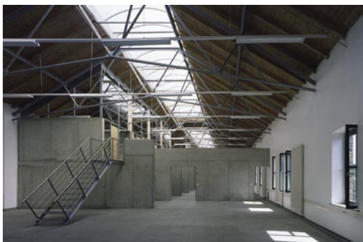
Halle 302: neue Einbauten

Die Halle 302 ist Teil der Strategie, durch gezielte Interventionen die Wahrnehmung eines Standortes zu verändern. Das in ihr entstandene Kombibüro für eine Agentur wird geprägt durch den Kontrast der aus statischen Gründen eingehängten Betonscheiben zur umgebenden Hülle der Industriehalle. Im rückwärtigen Bereich liegen Zellen für konzentrierte Einzelarbeit und Servicefunktionen. Eingestanzt in diese Schiene sind die hallenhohen informellen Besprechungsorte, davor liegen die Gruppenarbeitsräume. Die Gangway ist der Ort der Überlagerung beider Bereiche. Sie ist Erschließung und Bühne, um einen dynamischen Arbeitsalltag zu inszenieren.