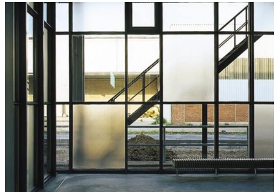
Studio 449: Ausblick in die Umgebung

Die neu in die Halle eingebauten Elemente sind durchlässig, das Industriegebäude wird nicht verleugnet, es wird ein wichtiger Bestandteil der neuen Situation