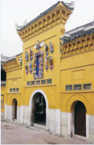
Der Ciyun Tempel nach Sanierung und Umbau