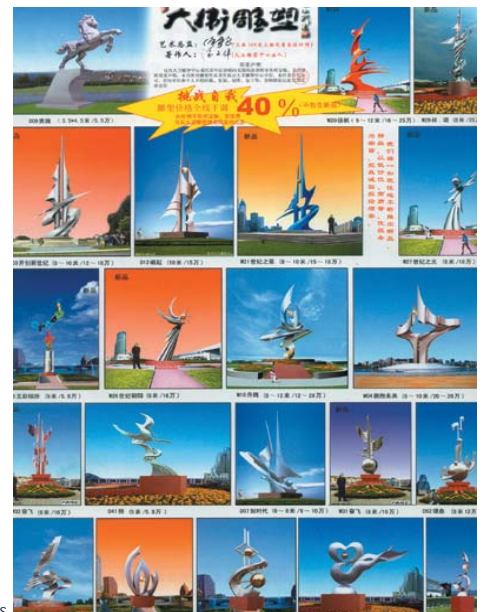
Dekoration des öffentlichen Raums