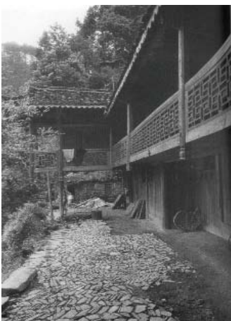
Haus der Miao-Nationalität

In der südchinesischen Provinzhauptstadt Guiyang findet vom 15. - 21. März 2004 eine deutsch-chinesische Fachtagung zum Thema "Erhalt und Nutzung traditioneller Bausubstanz" statt.