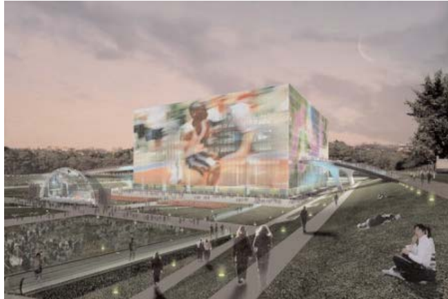
Die Fassade des Wukesong-Kultur- und Sportzentrums wird als Bildschirmwand genutzt.