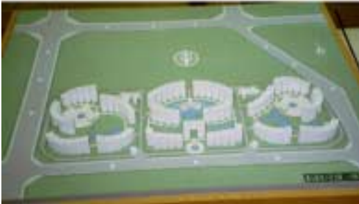
Planungsidee für das Projekt Xiangdeli zur Vorbereitung des Symposiums, Entwurf: Chen Jian