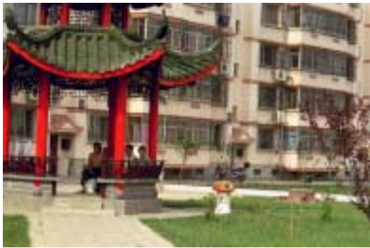
In einem Neubaugebiet in Tangshan