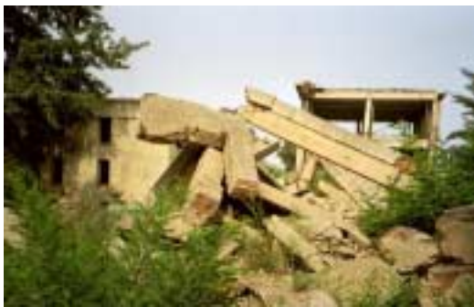
Konservierte Ruinen des Erdbebens von 1976