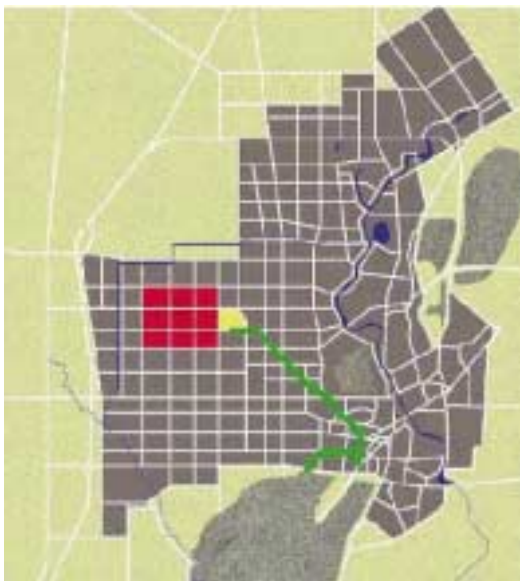
Schematische Darstellung der geplanten Stadtentwicklung von Tangshan. Die regelmäßigen Straßenzüge zeigen etwa die vorgesehene Stadterweiterung, das rote Quadrat das neue Stadtzentrum, die gelbe Fläche das Projekt Xiangdeli.

wieder sichtbar geworden, sie ließen sich aber in den allgemeinen Themen nur schwer genau fassen und diskutieren.