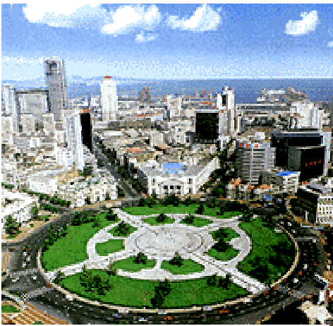
Die Hafenstadt Dalian, Schauplatz und Gegenstand des 6. Deutsch- Chinesischen Symposiums zu Archi- tektur und Stadtentwicklung

Der Verein verfolgt den Zweck, den Kulturaustausch zwischen Berlin und anderen großen Städten der Welt .... zu fördern und zu unterstützen.