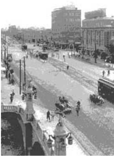
Dalian heute und in den 30er Jahren